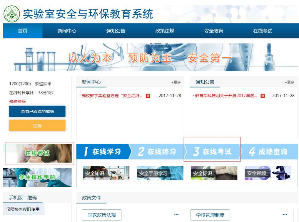
图 3 在学习完各项内容后必须接受考核参加“在线考试”

3、教育系统提供“政策法规”学习模块、“安全教育”学习模块（内容包括安全知识、安全手册、安全标识、安全视频、事故案例等）、在线练习模块（可以按知识分类进行在线练习，在线练习不限次数，练习成绩不计入考核成绩）。 同学们在学习以上内容完成后请务必进入“在线考试”栏目参加考试 ，在线答题并提交答案，答题时间为 45 分钟，系统将自动记录备案、评分。每个学生网上考试次数不超过 3 次。如取得 2 个以上的成绩，以取得的最高分数为准，作为本门教育科目的最终考核成绩，本科生（含预科）成绩 80 分以上（含 80）为合格，研究生成绩 90 分以上（含 90）才算合格。